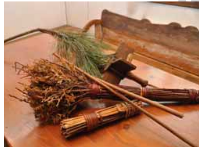
Palma, głowinka i kołatka wielkopostna

są symboliczne palmy. Palma bestwińska powinna być cała zielona, nie ma w niej elementów sztucznych, suszonych lub papierowych. Jedyny wyjątek od tej zasady przeznaczony jest dla kwiatów trzciny pospolitej , którą wtykali w palmę gospodarze mający stawy rybne. Każdy składnik miał swoje znaczenie. Leszczyna (lyska) to zdrowie lub prosta droga do zbawienia; jałowiec – cierpienie, korona cierniowa; śliba (dereń, wierzba czerwona) – krew Chrystusa; bazie – nowe życie. Dodawano ponadto drzewo graniate (trzmielina pospolita), czarną sosnę , żywortnik (tuję). W Wielką Sobotę opalało się przy kościele tzw. głowinki palmowe . Pozyskany popiół służył do posypania głów w Środę Popielcową, zaś z pozostałej leszczyny i śliby robiono krzyżyki wtykane pod pierwszą zaoraną skibę albo w cztery rogi obejścia. Kwiatostany wierzby (bazie kotki) czasem spożywano, wierząc, że uchroni to od chorób gardła.