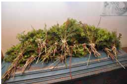
Palmy w Muzeum Regionalnym

Wprowadzeniem do Wielkiego Tygodnia jest Niedziela Palmowa . Na pamiątkę wjazdu Chrystusa do Jerozolimy wyrabiane