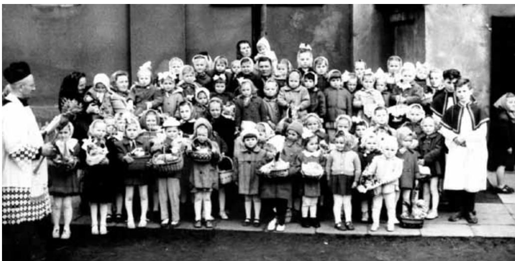
Święcenie pokarmów – Kaniów, lata 50