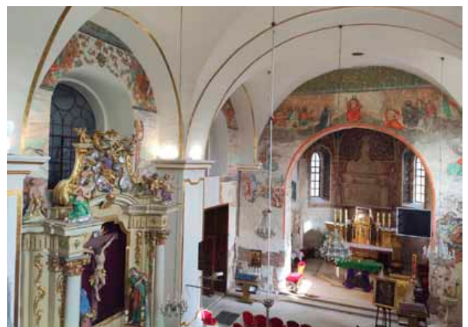
Wnętrze kościoła po zdjęciu rusztowań

Postęp dalszych prac zależy od pozyskanych w przyszłości środków. Konserwacja prezbiterium jest bowiem finansowana z innego programu. Parafia puka do drzwi różnych instytucji: Urzędu Marszałkowskiego, Wojewódzkiego Konserwatora Zabytków i (bezsukutecznie) do Ministerstwa Kultury. – Sami nie jesteśmy w stanie sfinansować przedsięwzięcia – ubolewa proboszcz – dlatego liczymy na pomoc odpowiednich władz w większym wymiarze. Chcemy jak najszybciej zakończyć prace nad piękną polichromią, według fachowców genialną, jak również nad ołtarzem. Każdy rok przynosi nam nowe rzeczy, mamy już