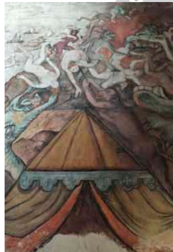
Scena z potworem morskim

Nad bocznym portalem pozostawiono ślady okien gotyckich , szerszych niż te prezbiterialne, otoczonych piękną bordiurą. Jeszcze dalej prawdopodobnie spotkanie Maryi z matką. Barokowe filary zakłóciły zatem swoisty „komiks teologiczno-liturgiczny” biegnący w dwóch płaszczyznach. Ks. Dulka nadmienia jeszcze, że w tamtych czasach wyraźnego znaczenia nabierało orientowanie kościoła – wszyscy wierni, razem z kapłanem, byli zwrócenii w kierunku Boga. Zatem mówienie, że kapłan stał „tyłem do ludzi” jest w gruncie rzeczy błędne. Ołtarze główne skierowane były w stronę wschodu. Później, w baroku, pojawiły