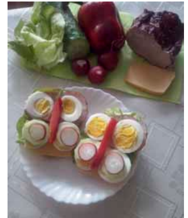
Wielkanocne „motylki” – propozycja podania

Wykonanie: Białka z cukrem ubić na sztywno, dodać żółtka i stopniowo na przemian olej i maślankę. Na koniec dodać mąkę połączoną z proszkiem do pieczenia i wymieszać łyżką. Całość wlać do nasmarowanej tłuszczem i posypanej bułką tartą formy (babki). Włożyć do piekarnika nagrzanego do 180°C. Piec około 40 min. Odłożyć do wystudzenia, a następnie polać utartym lukrem.