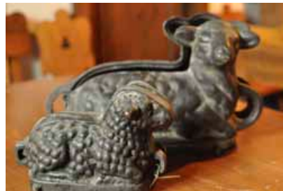
Tradycyjne formy na baranka

Wielki Tydzień obfitował w szereg unikalnych zwyczajów. Ks. Bubak pisze, że w Wielki Czwartek, Piątek i Sobotę, gdy w kościele rozlegały się kołatki, ludzie trzęśli drzewkami w ogrodach, by był urodzaj na owoce. Trwało wielkie sprzątanie: bielono, myto i czyszczono izby, sprzęty i naczynia. Przy kaplicy tzw. „Bożego Grobu” wartę zaciągali przedstawiciele organizacji społecznych, dzisiaj są to przede wszystkim druhowie Ochotniczej Straży Pożarnej.