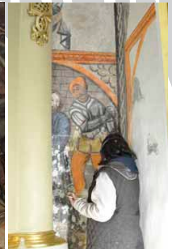
Prace konserwatorskie wciąż trwają

się ołtarze na ścianach, niejako też „zakłócające” całą malarską narrację. W Bestwinie nie ma ściany zachodniej – kościół został przedłużony. – Proszę sobie wyobrazić piękny fryz, u góry maskarony, a w wiciach pięknych owoców w żywych kolorach – tonda z apostołami. Kiedyś musiały to być cała kolorowa opowieść, prawdziwa „Biblia Pauperum”.